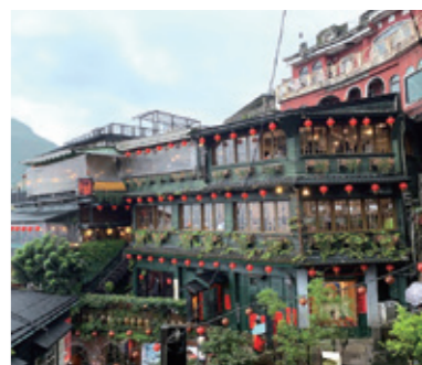
海外ホームステイ短期留学(希望者)

3年次総合的な探究の時間ではグループ別にテーマを決め約半年間研究を行います。大学教授を招いての授業や理化学研究所の見学会なども行っています。