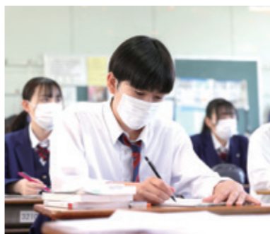
国立大学入試、6教科8科目対応

普通科のカリキュラムは、6教科8科目の国立大学入試に対応しています。幅広い選択科目と熱心な指導により、難関国立大学進学を目指すことができます。