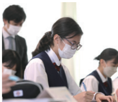
英検の資格取得に挑戦

オーストラリア・アメリカ・イギリスでの海外ホームステイ、セブ島・ベトナム・台湾での短期留学を実施しています。