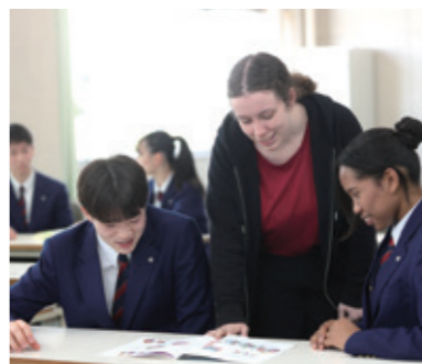
充実した語学指導

普通科のカリキュラムは、6教科8科目の国立大学入試に対応しています。幅広い選択科目と熱心な指導により、難関国立大学進学を目指すことができます。