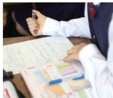
地球規模の課題を学ぶ「グローバルイシューズ」

論理表現ではALTによる指導を進めています。スピーチ、プレゼンテーション、パラグラフライティングも実施しています。