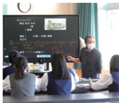
理科教育の充実(選択)

コンピュータ室と特別教室にトータルで約160台のパソコン、普通教室全てにプロジェクターを設置、生徒用のタブレットを導入しています。