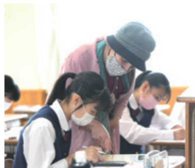
世界との交流を広げる第二外国語(選択)

本校では「実用英語技能検定」の受験を積極的に奨めています。面接試験の指導も行います。